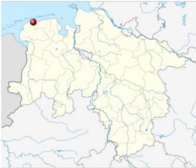
Lage von Nesse in Niedersachsen